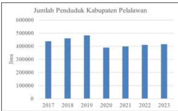
Gambar 1. Jumlah Penduduk Kabupaten Pelalawan

Berdasarkan data Badan Pusat Statistik, Kabupaten Pelalawan mengalami fluktuasi jumlah penduduk yang cenderung meningkat hingga tahun 2023. Peningkatan jumlah penduduk berimplikasi pada meningkatnya kebutuhan akan lapangan kerja, pendidikan, dan layanan sosial lainnya. Grafik perkembangan penduduk Kabupaten Pelalawan menunjukkan bahwa tekanan terhadap kebutuhan ekonomi masyarakat semakin besar seiring pertumbuhan penduduk.