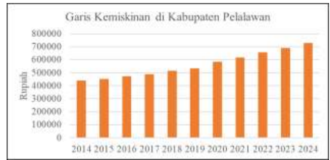
Gambar 2. Garis Kemiskinan di Kabupaten Pelalawan

Berdasarkan data BPS Statistik yang dapat dilihat pada grafik diatas, Kabupaten Pelalawan mengalami perubahan penurunan jumlah penduduk, namun perlahan meningkat hingga tahun 2023. Dengan bertambahnya penduduk nya, maka kebutuhan akan meningkat, baik itu kebutuhan lapangan pekerjaan, sandang pangan, pendidikan (Ramadhan, 2018). Selain itu, data garis kemiskinan menunjukkan adanya kecenderungan peningkatan angka kemiskinan dalam beberapa tahun terakhir. Kondisi ini tidak serta-merta mencerminkan kegagalan program CSR, karena kemiskinan dipengaruhi oleh berbagai faktor struktural dan makroekonomi. Namun demikian, meningkatnya angka kemiskinan dapat menjadi indikasi bahwa program CSR yang ada belum sepenuhnya mampu menjangkau atau menjawab kebutuhan ekonomi masyarakat secara luas (Al-Mau'izhah:, 2024).